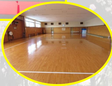
水島武道館事務所