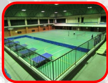
水島体育館事務所