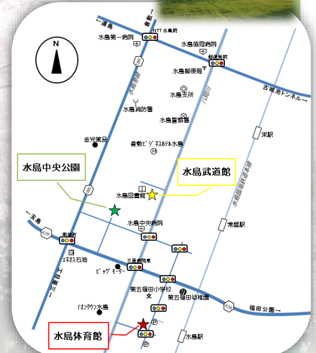
水島中央公園管理事務所