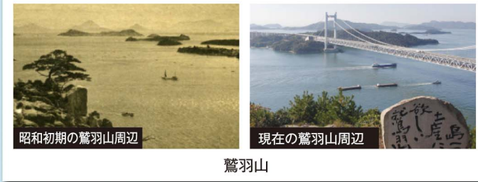
昭和初期の鷺羽山周辺