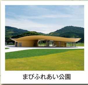
まびふれあい公園