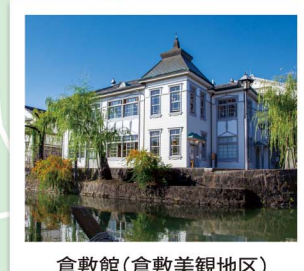
倉敷館(倉敷美観地区)